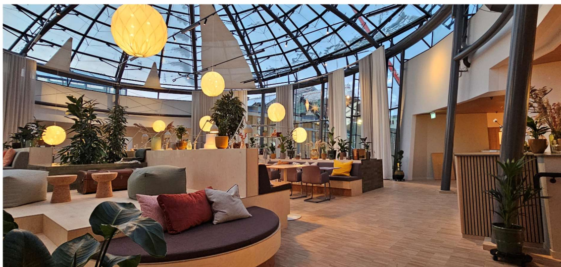
2023 flyttade vi till Dospace Innerstan i Norrköping. Här främjar vi Norrköpings företagare, både blivande och etablerade, genom kostnadsfri rådgivning och en mängd event som vi planerar att utöka under 2024.

Nyföretagarcentrum har under året påbörjat flera spännande samarbeten i Norrköping, bland annat med Företagarna Norrköping, Portalen och Stadsmissionen. Dessa samarbeten förväntas utvecklas vidare under 2024 och kommer att bidra till att stärka stödet för företagande och entreprenörskap i staden. Vi ser fram emot att fortsätta vara en viktig resurs för Norrköpings företagande och att bidra till stadens tillväxt och utveckling.